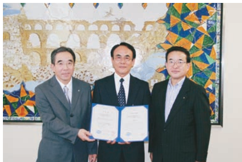
9月3日桐生市水道局水質センター

水道 GLP 認定委員会で認定が決定した下記の水質検査機関の認定証授与式を日本水道協会専務理事室において行った。