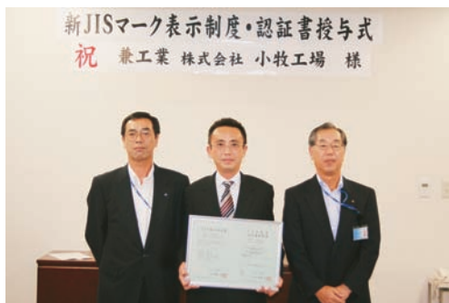
兼工業(株)小牧工場

第28回 JIS 製品認証業務判定委員会において、各申請者の初回認証判定について、適合と判定され、このうち、兼工業(株)小牧工場、(株)ヨシタケ及び幡豆工業(株)の JIS 製品認証マーク表示制度・認証書授与式が行われた。