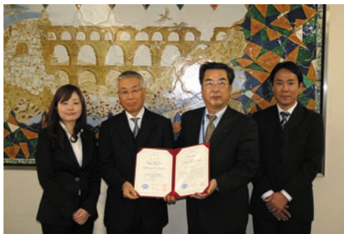
12月18日 池田市上下水道部水質管理課 (認定番号：JWWA-GLP056)

水道 GLP 認定委員会で認定が決定した下記の水質検査機関の認定証授与式を日本水道協会専務理事室において行った。