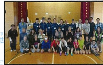
サプライズ！避難所でお別れ会