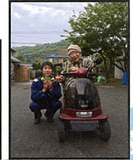
おばあさんからたわしのお礼