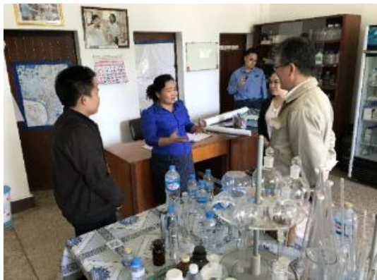
水質検査室でのヒアリング