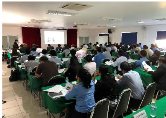
クロージングセミナーの様子