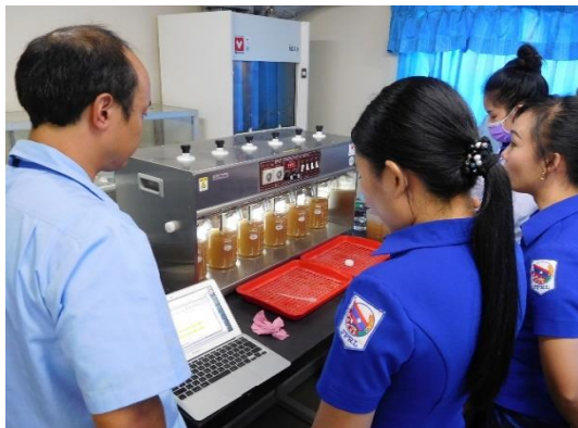
カムアン県での水質管理指導の様子