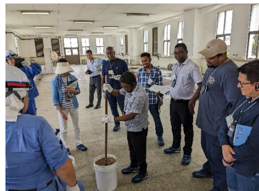
浄水処理に関する実習