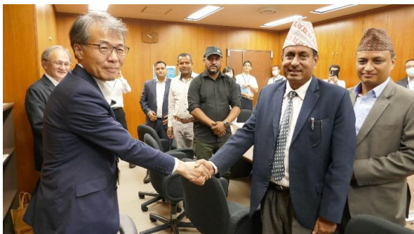
【水道事業管理者表敬の様子】