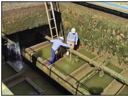
現地施設調査（タイ）