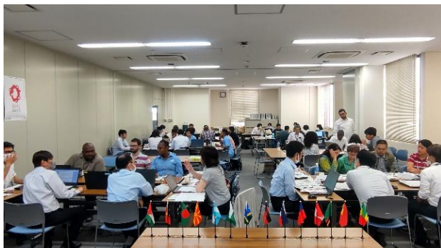
コンサルテーション