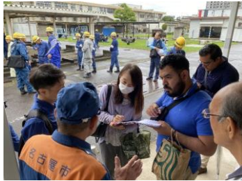
第2回本邦研修 防災訓練の視察