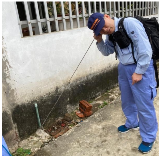
ランソン省現地での漏水調査の様子