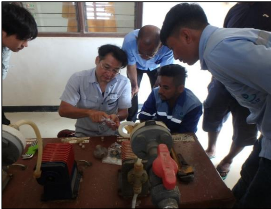
葉注ポンプ修繕の指導状況