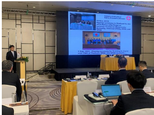
ラオスでのクロージングセミナー