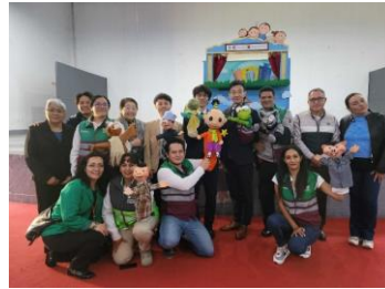
第5回職員派遣 災害時水利用啓発の人形劇