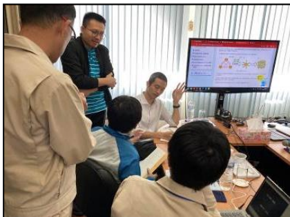
打合せ・意見交換（タイ）