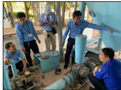
現地施設調査（ラオス）