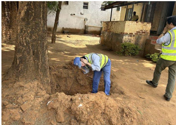
マラウイ国での漏水調査