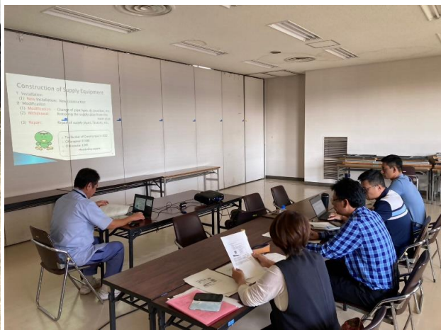
政策研修員研修の講義の様子