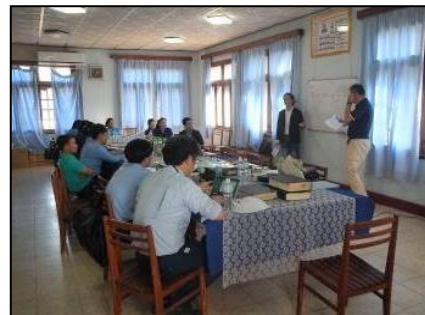
打合せ・意見交換（ラオス）