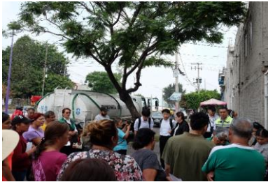
第4回職員派遣 市民との応急給水訓練