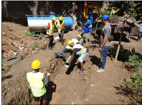
配水管整備工事の様子