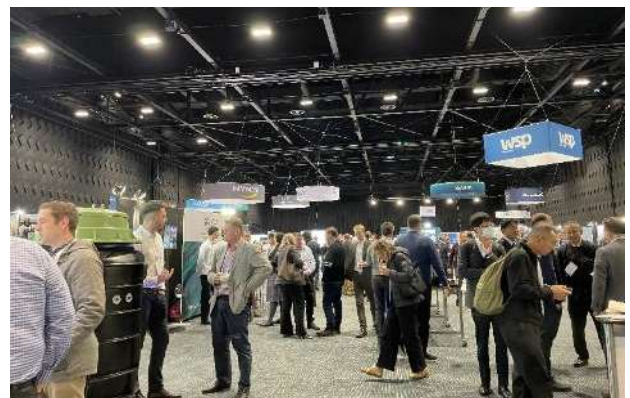
写真-4 展示会の様子

会場では、9月30（火）～10月2日（木）の3日間にわたって展示会が開催され、メーカーや官公庁など、多数のブースが出展された。日本からは東京都、横河電機、コスモ工機、栗本鐵工所が出展しており、製品の模型やパネルを用いて、海外の方々に製品や取り組みについて説明を行っていた。（写真-4）