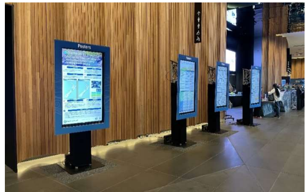
写真-3 ポスター表示用ディスプレイ

本会議では、ポスター発表も行われた。クライストチャーチ・タウンホールでは紙のポスターが張られていたほか、テ・パエ・クライストチャーチコンベンションセンターには液晶ディスプレイ（写真-3）が4台設置され、ポスターが順番に表示されるようになっていた。ポスター発表の対象者は、関連する口頭発表のセッションの最後に、3分間説明時間が設けられており、それぞれの研究や取り組みの内容を説明していた。