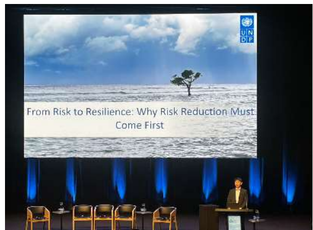
写真-1 Kim氏による基調講演

Kim氏からは、2015年に仙台で開催された国連防災世界会議において、東日本大震災をうけて採択された「仙台防災枠組」が紹介された。また、UNDP(国連開発計画)の取り組みとして、災害時の早期警報システムの強化、災害復旧フレームワークガイドの策定による上下水道回復力の強化、気候変動への対応のためのマングローブ修復、ベトナムでの上下水道インフラの再建などが紹介され、事前の準備、システムでの対応、短期より長期、協働というパラダイムシフトが必要であると述べた。(写真-1)