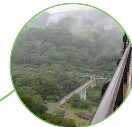
未完成の水源施設